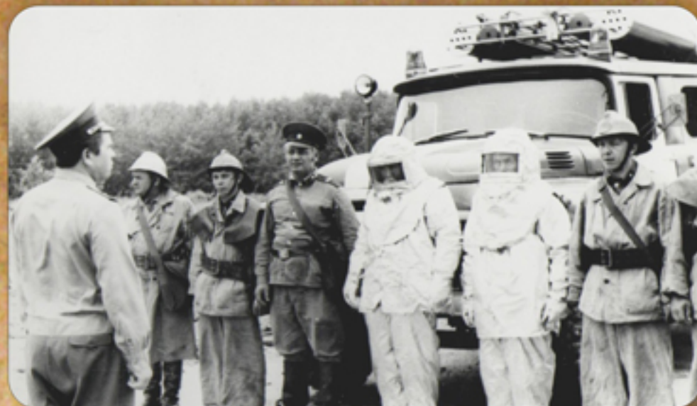
Проведение занятий по ППС ГО

С 4 июля 1961 года по 22 февраля 1963 года на должности помощника инструктора профилактики ВВПК предприятия п/я №46. С 22 февраля 1963 года по 30 ноября 1966 года помощник инструктора профилактики ВПЧ-1 ОПО-22 УПО МООП РСФСР. С 30 ноября 1966 года по август 1979 года на должности помощника инструктора профилактики ВПЧ-1 ОПО-22 ГУПО МВД СССР. Награжден нагрудным знаком "Отличный пожарный", медалями "За безупречную службу" 3-ей, 2-ой и 1-ой степеней.