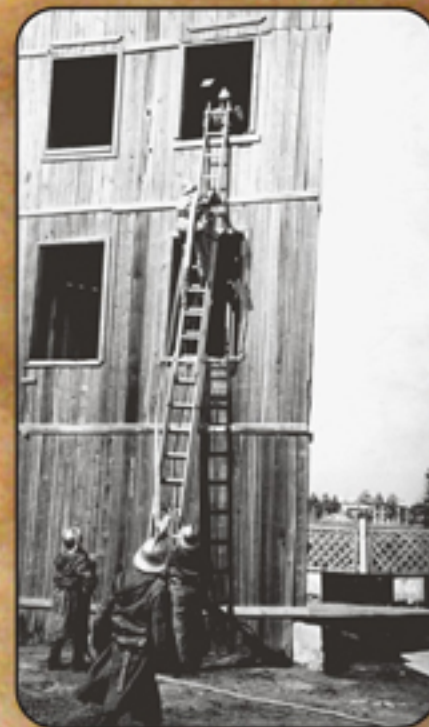
Учебная башня ВПЧ -1

С 18 января 1957 года продолжил службу на должности шофера пожарной автомашины ВВПО предприятия п/я 41 (с февраля 1959 года предприятия п/я 46). С 22 февраля 1963 года зачислен на должность шофера пожарной автомашины ВПЧ-1 ОПО -22 УПО МООП РСФСР, с октября переведен в ВПЧ-2 года по 11 февраля 1985 года на должности помощника инструктора профилактики ВПЧ-2 ОПО -22 УПО МООП РСФСР. С 19 сентября по 31 декабря 1976 года служил на должности старшего шофера пожарных автомашин ВПЧ-2 ОПО-22 ГУПО МВД СССР. Награжден медалями "За безупречную службу" 3-ей, 2-ой и 1-ой степеней.