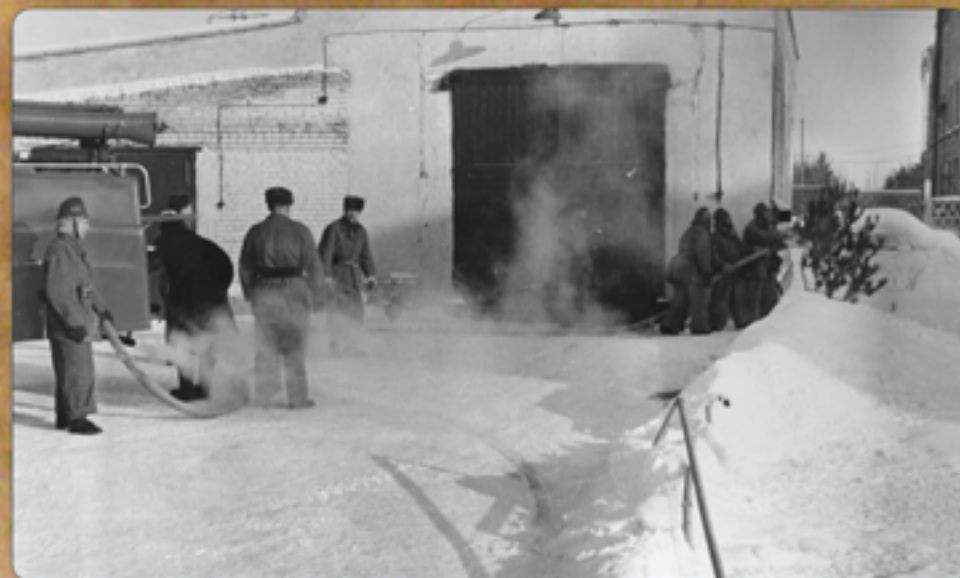
Пожарно-тактические учения на охраняемом объекте.

Награжден орденами Славы III степени и "Отечественной войны" II степени.