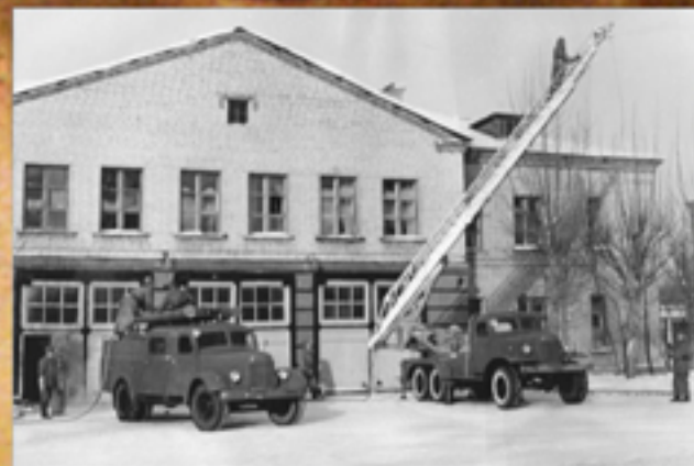
Первое здание пожарного депо ВПЧ-1