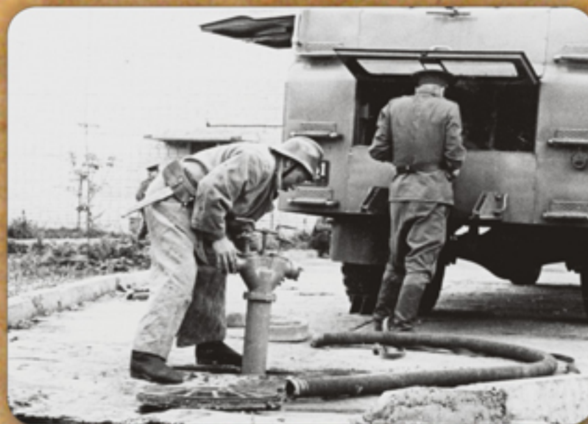
Установка автоцистерны на пожарный гидрант

Награжден медалью: «За безупречную службу» 3-ей степени.