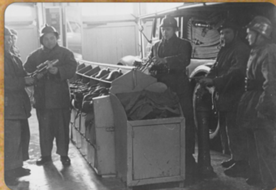
Личный состав дежурного караула ВПЧ-1 проводит обслуживание ПТВ

Во время Великой Отечественной войны в период с августа 1943 года по 9 мая 1945 года принимал участие в боевых действиях на Западном фронте в составе 862-ого истребительного авиационного полка 320-ой истребительной дивизии 20-ой воздушной армии.