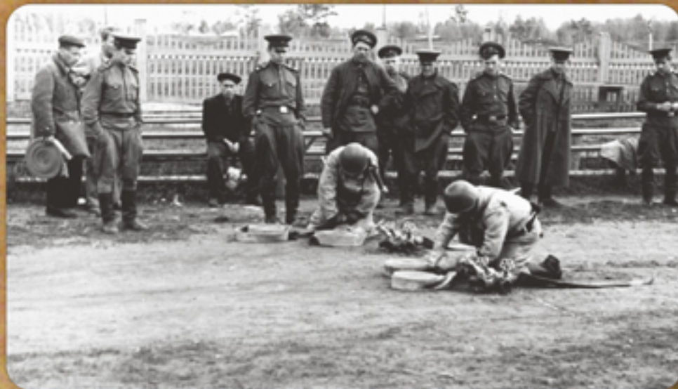
Соревнования по пожарно-прикладному спорту

Службу в пожарной охране проходил с 22 февраля 1963 года по 15 марта 1968 года на должности командира отделения ВПЧ-1 ОПО -22 УПО МООП РСФСР и с 15 марта 1968 года по 31 июля 1986 года на должности помощника инструктора профилактики ВПЧ-2 ОПО-22 ГУПО МВД СССР. Награжден нагрудным знаком "Отличный пожарный", медалями "За безупречную службу" 3-ей, 2-ой и 1-ой степеней.