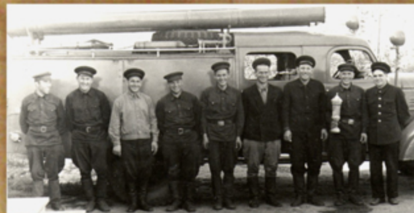
Сборная команда спортсменов ВВПК