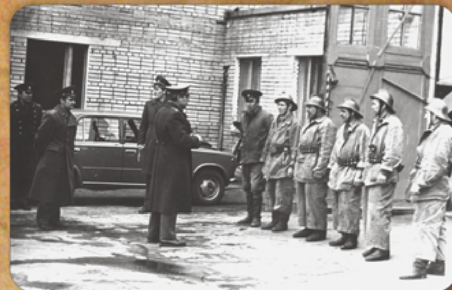
Инструктаж по технике безопасности перед боевым развертыванием