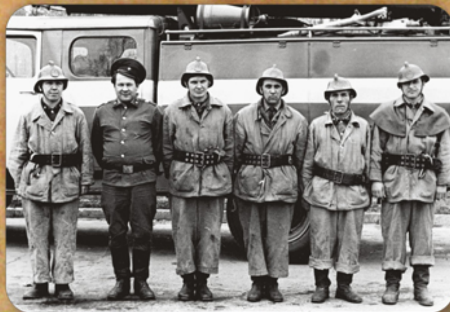
Боевой расчет отделения дежурного караула ВПЧ-1

Службу в пожарной охране проходил с 28 января 1956 года на должности командира отделения ВППО предприятия п/я 41 (с февраля 1959 года предприятия п/я 46). С 22 февраля 1963 года зачислен на должность командира отделения ВПЧ-1 ОПО -22 УПО МООН РСФСР, с 4 марта 1975 года по 1 сентября 1975 года проходил службу на должности помощника инструктора профилактики ВПЧ-1 ОПО-22 ГУПО МВД СССР. Награжден нагрудным знаком "Отличный пожарный".