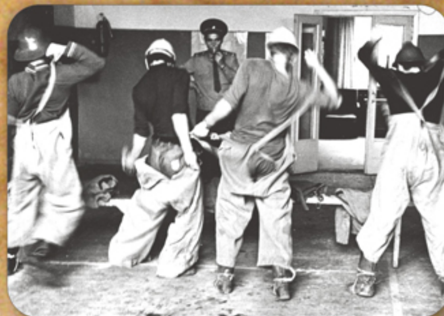
Отработка норматива номер 1 по ПСП

Во время Великой Отечественной войны в период с 9 августа 1945 года по 3 сентября 1945 года принимал участие в боях на Восточном фронте в составе 112-ого гвардейского стрелкового полка. Награжден медалями: "За боевые заслуги", "За победу над Японией".