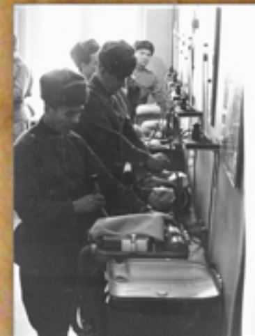
Обслуживание противогазов КИП-7

Награжден медалями «За безупречную службу» 1-ой, 2-ой, 3-ей степеней.